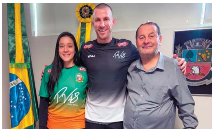
LUTÉCIA Página 5