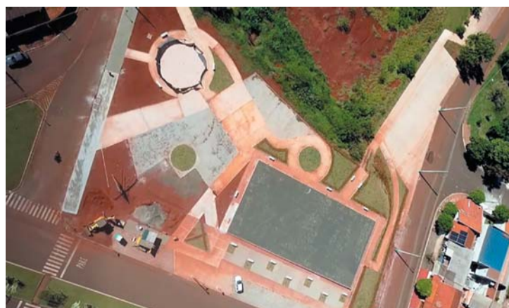
TARUMA Página 4