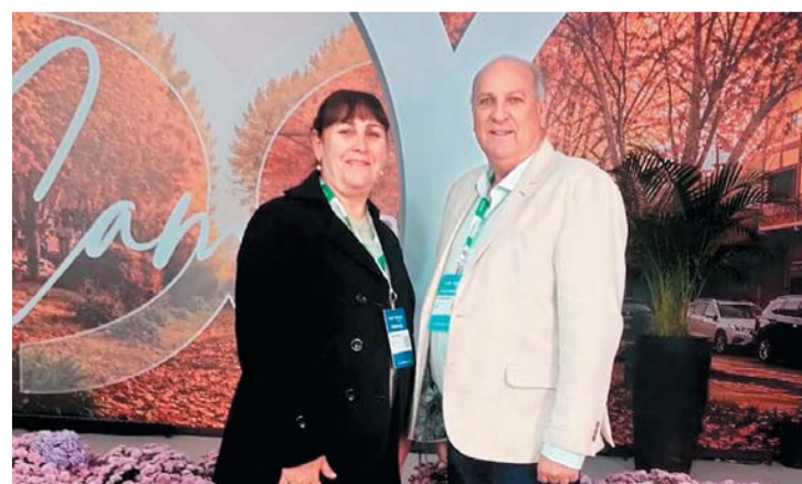
TARUMÃ Página 4