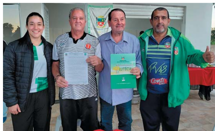
LUTÉCIA Página 5